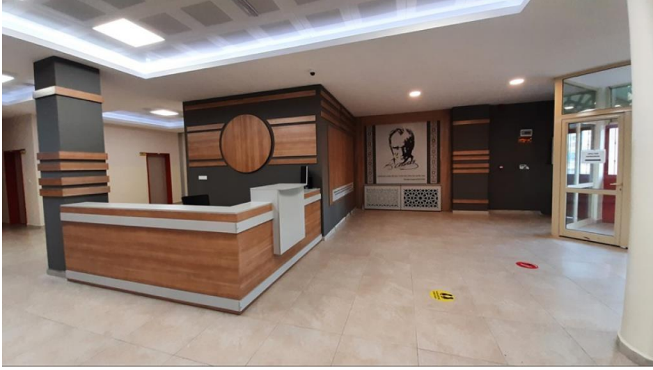
Zemin Kat. Okul Girişi